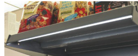
Lückenloses Licht: Kein Produkt soll im Schatten verkümmern

bel und nahezu unsichtbar angeordnet werden. Flat-Track ist in zwei Standardlängen von 1500 und 2600 mm erhältlich und kann beliebig gekürzt werden. Die Systemleistung pro Einheit beträgt maximal 115 Watt. Standardfarbe ist