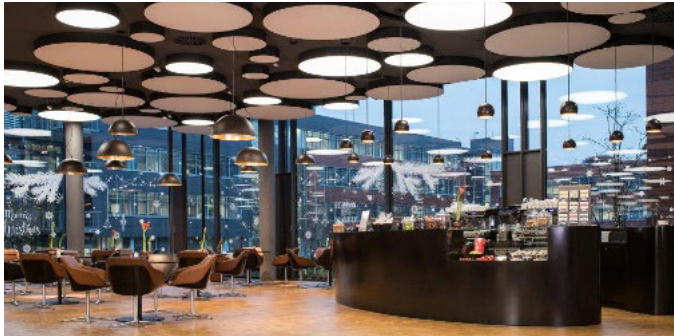
Weg vom ewigen Weiß: Corian gibt es auch in schokoladigem Braun

Moser ist auf derartige Projekte spezialisiert: mit einem hochmodernen Maschinenpark ist das Unternehmen in der Lage, Innenausbauprojekte auf höchstem Niveau zu stemmen. Das Handwerk wird dabei nicht vergessen: Als verlängerte Werkbank ist das Unternehmen für zahlreiche Tischler und Schreiner tätig.